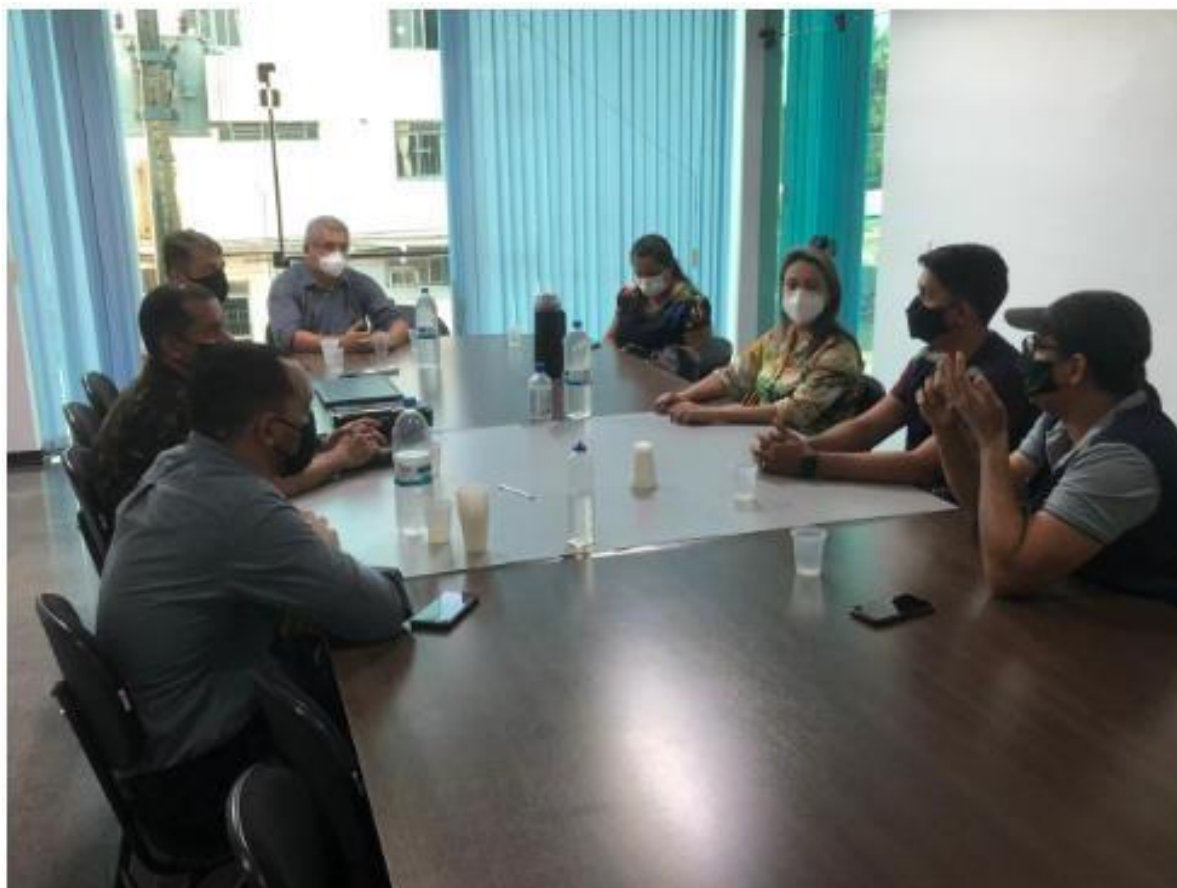
Reunião do COE para analisar o decréscimo da Covid-19 em Porto Nacional