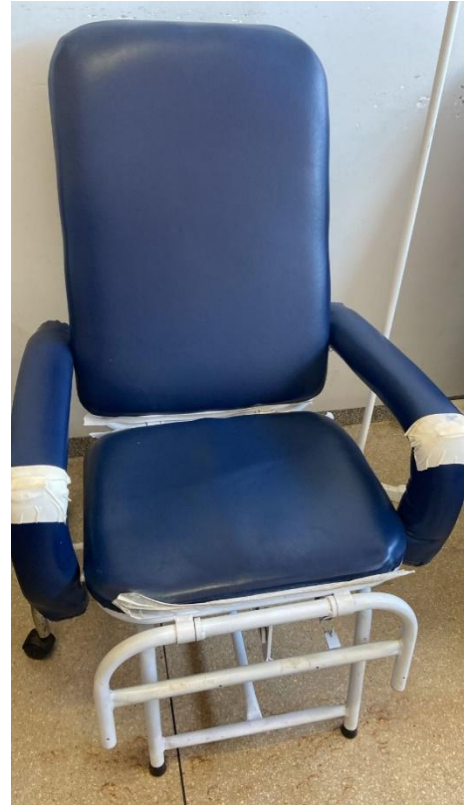
UNIDADE DE PRONTO ATENDIMENTO-UPA