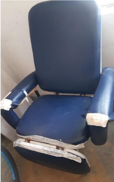
CENTRO DE ESPECIALIDADES MÉDICAS-CEME

Relatório fotográfico das cadeiras e colchões a serem reformados.