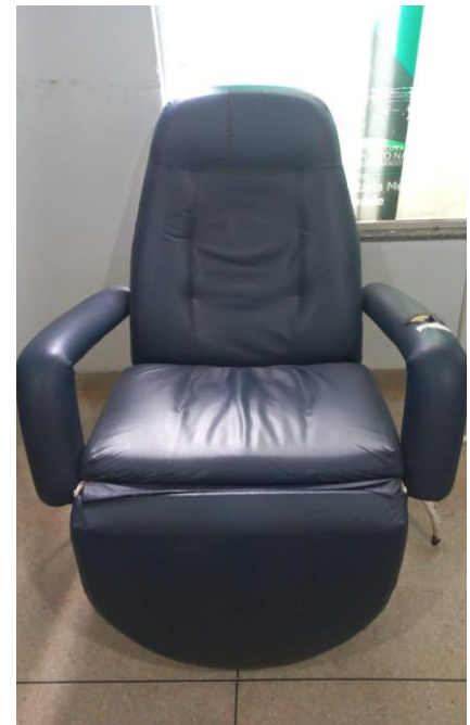
UNIDADE DE PRONTO ATENDIMENTO-UPA