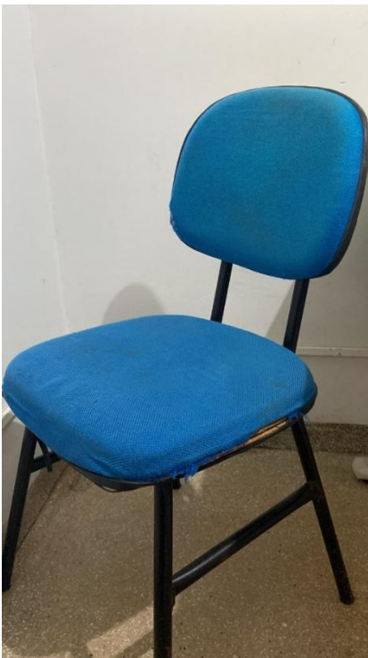
CENTRO DE ESPECIALIDADES MÉDICAS-CEME