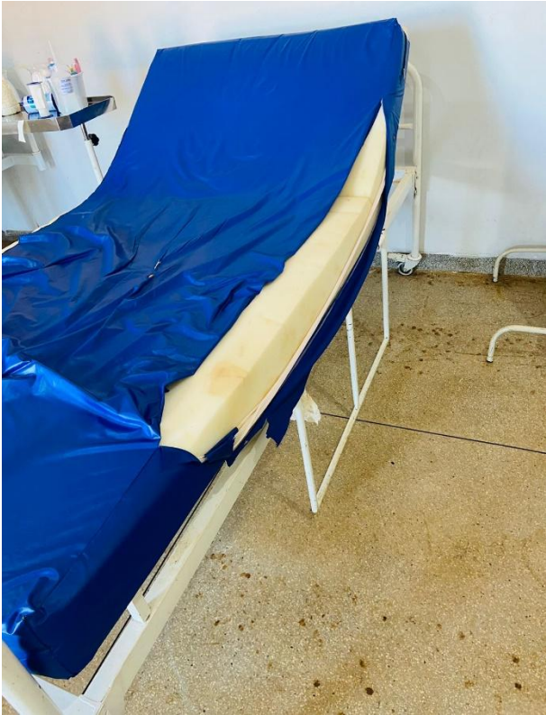
UNIDADE DE PRONTO ATENDIMENTO-UPA