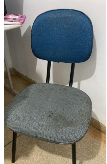
CENTRO DE ESPECIALIDADES