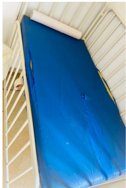
UNIDADE DE PRONTO ATENDIMENTO-UPA