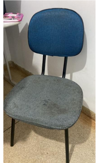
CENTRO DE ESPECIALIDADES